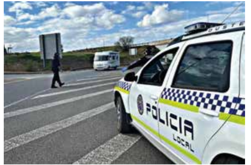
Una de las actuaciones llevadas a cabo por la Policía Local

Otro tipo de actuaciones realizadas por la Policía Local en dicho periodo han sido la realización de 20 controles de movilidad en los puntos de acceso al municipio; se ha ejecutado un operativo diseñado para prevenir aglomeraciones e infracciones en la Plaza de la Tolerancia, con la colaboración de Guardia Civil; 1 actuación en casos de violencia de género; 2 actuaciones en casos de falsificación de moneda; 1 actuación en reyerta; 1