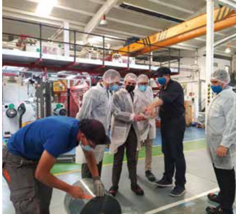
Herrador visitando la planta de Plastienvase en Espiel

Herrador afirmó también, que para apoyar a las empresas en el esfuerzo por crecer y seguir desarrollando soluciones innovadoras, facilitándoles en la medida de lo posible el camino y generar las condiciones para que su apuesta