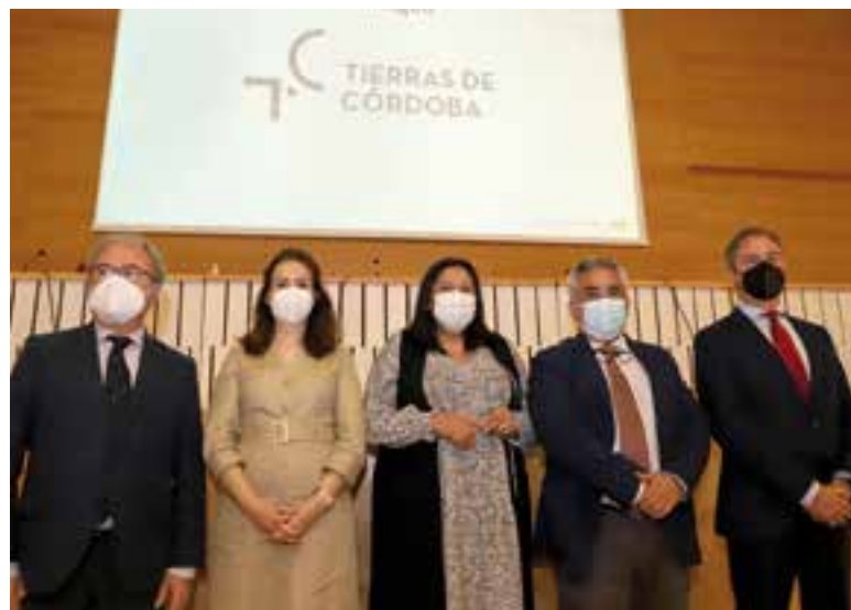
Acto de presentación de la marca 'Tierras de Córdoba'

"Se trata de ordenar la oferta turística bajo una marca-destino