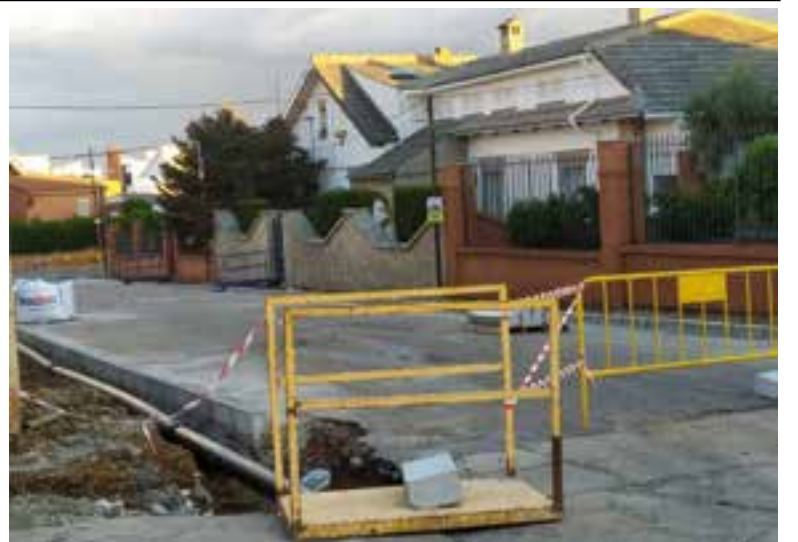
Estado de los trabajos en esta vía

actuación seguimos mejorando las infraestructuras básicas de la localidad, llegando a todas las zonas del municipio", y añadió que "la intención del actual equipo de gobierno es ir dando respuesta en la medida de lo posible a las deficiencias existentes en nuestro pueblo, que permitan mejorar el aspecto de la localidad".