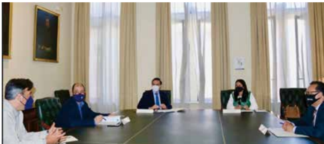
Primera reunión de la comisión

pués de que se firmara el convenio entre el Ayuntamiento de Fuente Obejuna y la Universidad de Córdoba. La creación de la comisión determinará pautas de trabajo para el corto y el medio plazo, y valorará qué colaboradores pueden acompañar al proyecto.