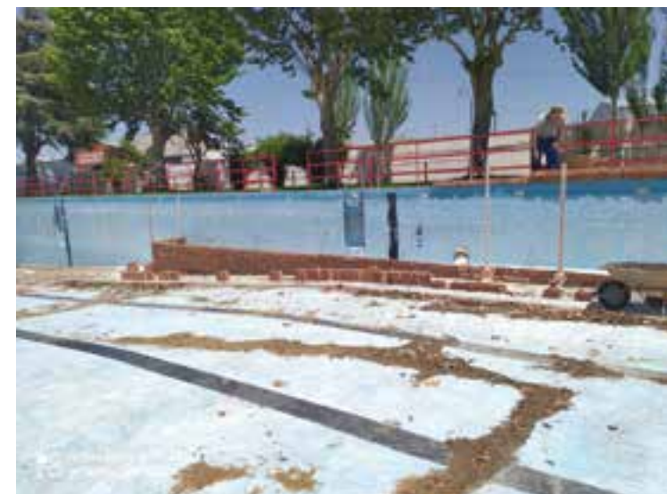
Trabajos realizados para la construcción de la rampa de acceso de la piscina municipal

Dentro de las tareas de mejora de la piscina, el consistorio llevó a cabo el pasado año la construcción de una rampa de acceso. Esta actuación se llevó a cabo a través de una ayuda concedida por la Diputación de Córdoba al Ayuntamiento de Peñarroya-Pueblonuevo. Esta intervención contó con un presupuesto de casi 12.000 euros, de los que 11.237 euros fueron aportados por la institución provincial. Las obras fueron ejecutadas por una empresa de la localidad, y tuvieron un plazo de ejecución de unos 30 días. Esta actuación se enmarcó en un plan provincial de eliminación de barreras arquitectónicas y actuaciones extraordinarias en infraestructuras públicas.