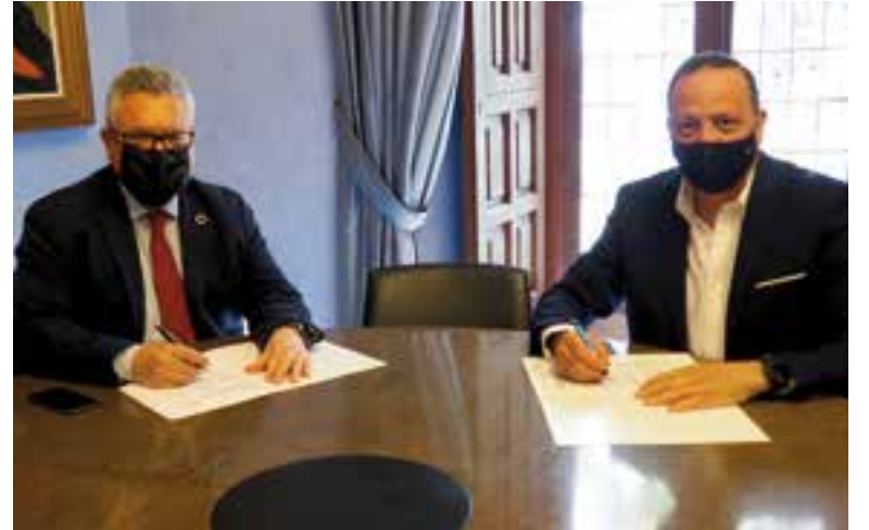
Acto de la firma del convenio