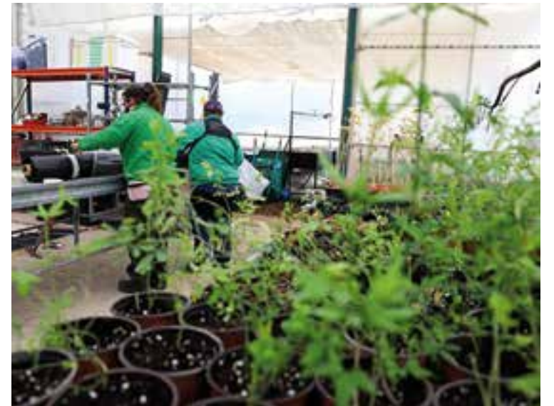
Algunas de las especies que se han entregado

Engloba un conjunto de actuaciones destinadas a proteger la biodiversidad, tanto en entornos rurales como urbanos, y a aportar beneficios ecológicos, económicos y de bienestar social a la población. Ejemplos de este tipo de intervenciones son los llamados tejados verdes, las soluciones técnicas para el aprovechamiento e infiltración de escorrentías, la incorporación de elementos vegetales en fachadas o la integración de arboleda en espacios urbanos para mitigar los efectos del cambio climático.