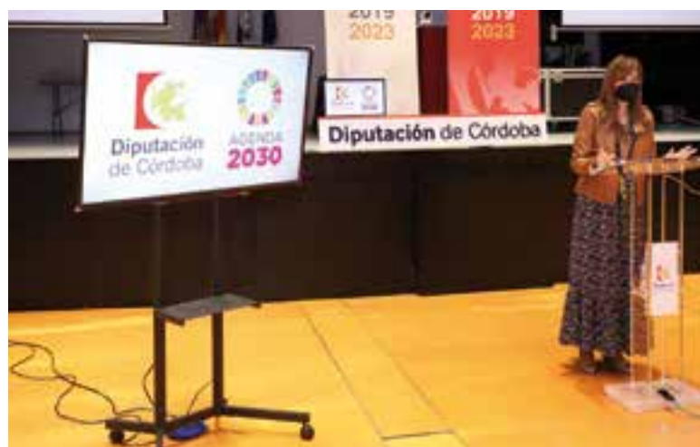
Esta subvención permitirá reorganizar los archivos

De igual modo, Cañete recordó que "la convocatoria permitirá a los ayuntamientos cumplir con la normativa que obliga a la accesibilidad y transparencia de los archivos municipales mediante su digitalización".