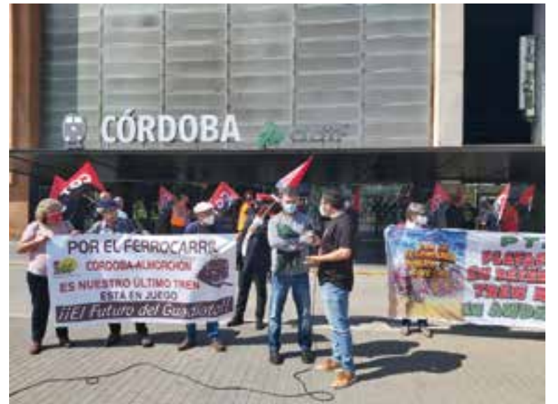
Representantes de IU en la manifestación organizada

Por último, Cabrera precisó que "exigimos una red ferroviaria acorde a la realidad de nuestros pueblos y que sea capaz de vertebrar nuestra provincia. Reivindicamos la apertura de la línea férrea Córdoba-Almorchón por el Futuro la Comarca del Guadiato. En defensa del tren rural, contra la despoblación y por una movilidad sostenible".