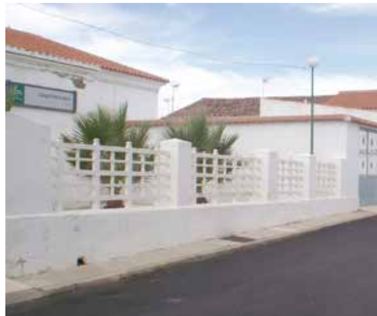
Colegio Ágora de Valsequillo

En la modalidad de Resto de Centros, han sido galardonados el IES