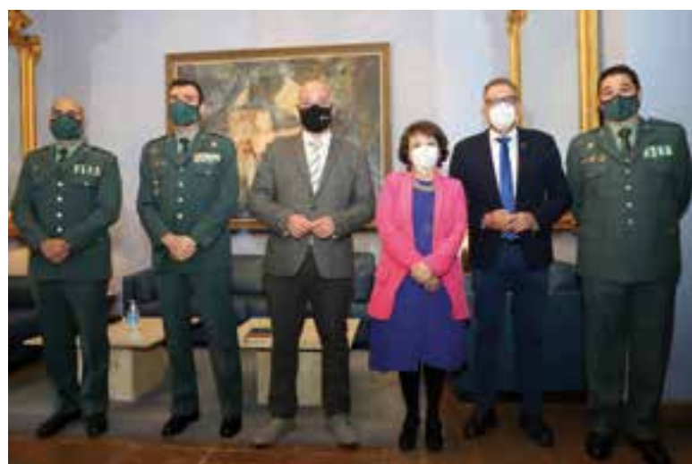
Acto de entrega de las obras de mejora de los cuarteles de la Guardia Civil

en las dependencias de Fuente Obejuna, mientras que en Peñarroya-Pueblonuevo se ha procedido a la rehabilitación de las cubiertas del bloque 5 y anexo a dicho bloque del cuartel de la Guardia Civil en dicho municipio.