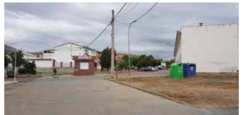
Vista de la barriada Santiago García Fuentes

llevar a cabo dos proyectos, por un lado, el suministro e instalación de elementos de juego y pavimento para construir un parque infantil en la barriada Santiago García Fuentes, y, por otro, se va a realizar una actuación de mejora en el suministro de agua potable, saneamiento y pavimentación en un tramo de la calle José Simón de Lillo; en materia medioambiental, se va a realizar la contratación de un técnico para gestionar actuaciones para la promoción y gestión de proyectos relacionados con el medio ambiente y control de la normativa medioambiental; en cuanto a servicios sociales y protección social, se va a contratar a personal técnico para ejecutar actuaciones de asistencia social con especial atención a colectivos en riesgo de exclusión social; en materia de urbanismo, se llevará a cabo la contratación de un técnico para la mejora de la gestión y tramitación de los procedimientos de contratación de dicha área; en materia de desarrollo empresarial, se van a instalar paneles informativos promocionales en los