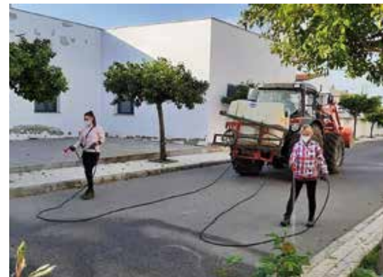
Tareas de desinfección en Valsequillo

A finales de abril hay en Fuente Obejuna 20 casos, en Peñarroya 9 y en Belmez 12.