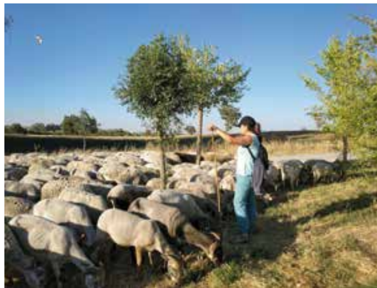
La propuesta de instalar la sede itinerante de la escuela en Los Blázquez se aplaza a 2022

En 2019, la Escuela de Pastores de Andalucía fue reconocida como actividad modelo de los Planes de Desarrollo Rural nacionales por la Red Rural Nacional que coordina el Ministerio de Agricultura, Pesca y Alimentación, y este año ha sido seleccionada entre los finalistas de los premios 'Rural Inspirations Awards'. Se trata de la primera vez que Andalucía está nominada a estos premios que otorga la Red Europea de Desa-